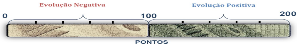
Figura 1: Concepção da formação do indicador